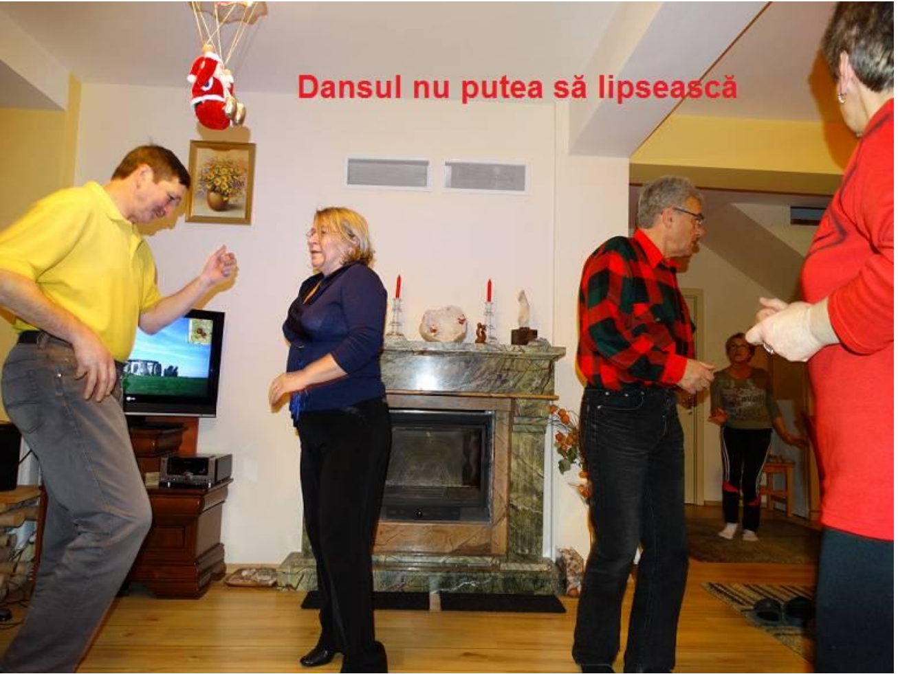
Dansul nu putea să lipsească